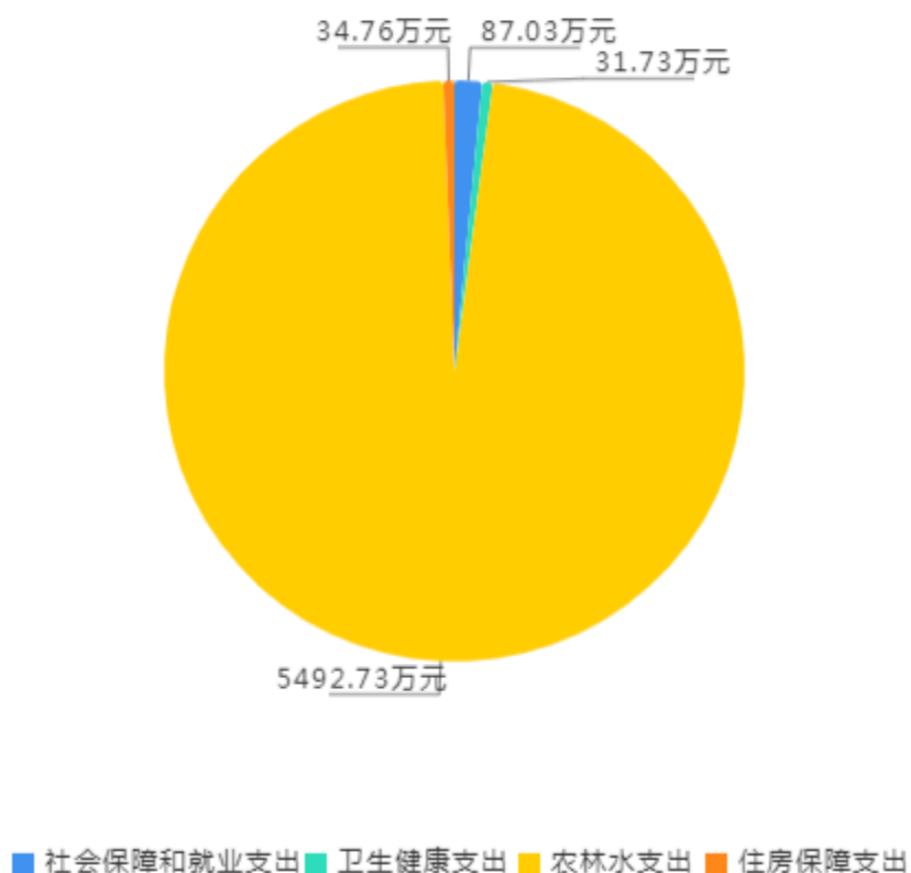
2024年财政拨款预算支出构成